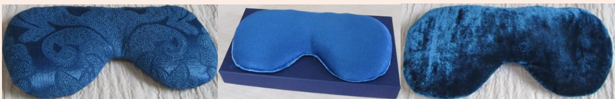
Damast - Musterbeispiel

Beim Damast variiert das Muster je nach Zuschnitt und bekommt so einen unikaten Charakter!