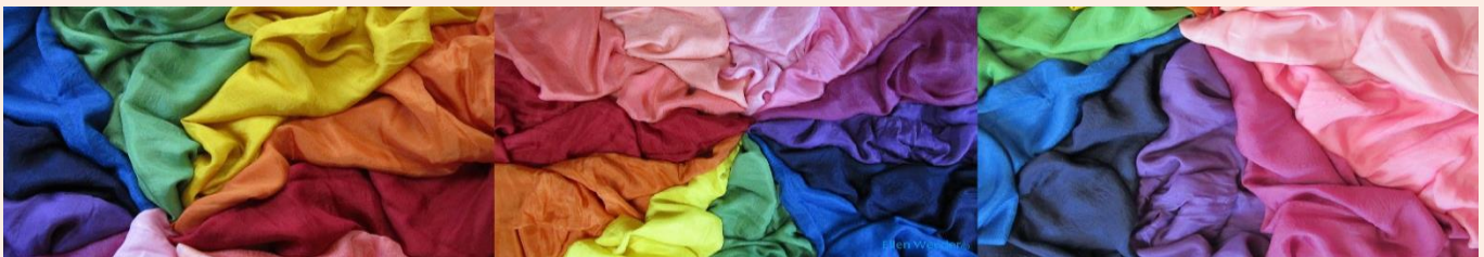
12-Farbenkreis nach Rudolf Steiner mit verschiedenen Nuancen des „Pfersichblüt“ im Spektrum zwischen Rot und Violett

Die hier vorgestellten Produkte werden von mir in einfühlsamer Handarbeit im eigenen Atelier mit Pflanzenfarben, Kristallen, Spagirik u.a. gestaltet und veredelt – sie bereichern Körper, Seele und Geist.