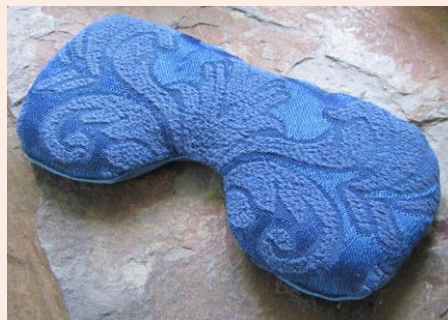
Unikat - Bildbeispiel